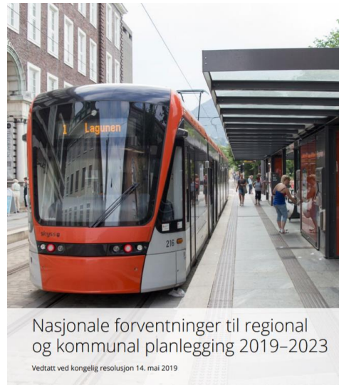
Nasjonale forventninger til regional og kommunal planlegging 2019–2023

Vedtatt ved kongelig resolusjon 14. mai 2019