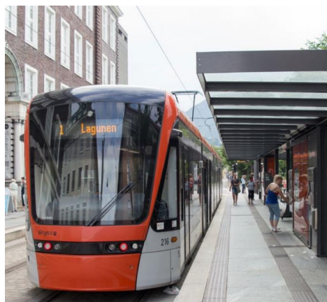
Nasjonale forventninger til regional og kommunal planlegging 2019–2023

Vedtatt ved kongelig resolusjon 14. mai 2019