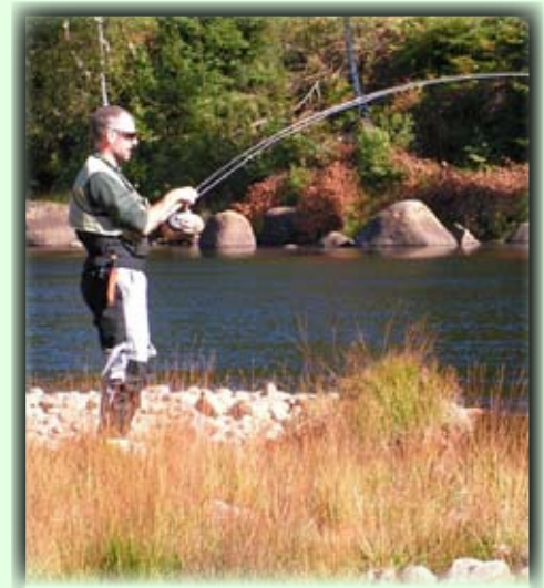
Laksen er på vei tilbake i elva og mange prøver fiskelykken!