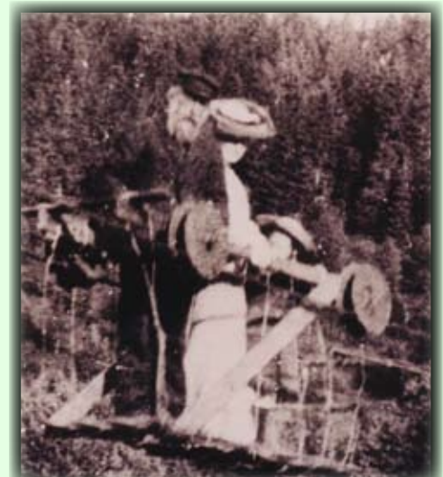
Slik ble damene fraktet over Slågedalsbrua for ca 100 år siden!