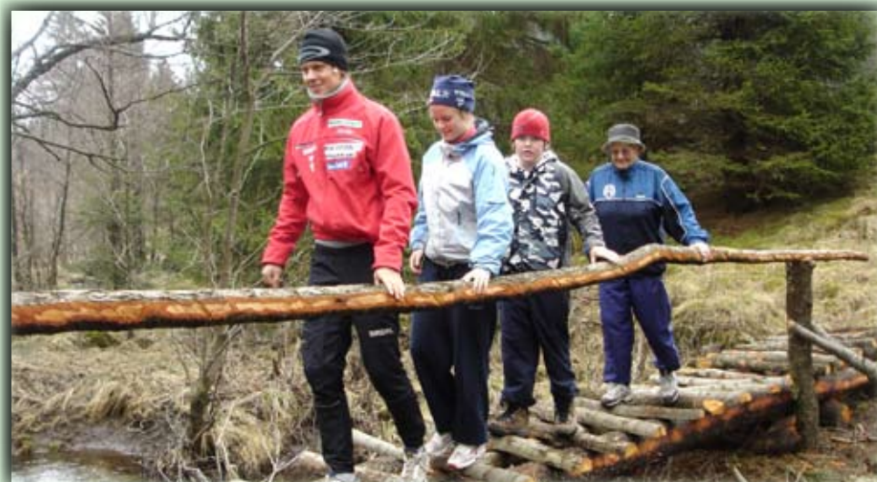
Denne flotte brua ligger ved Vassbotn: