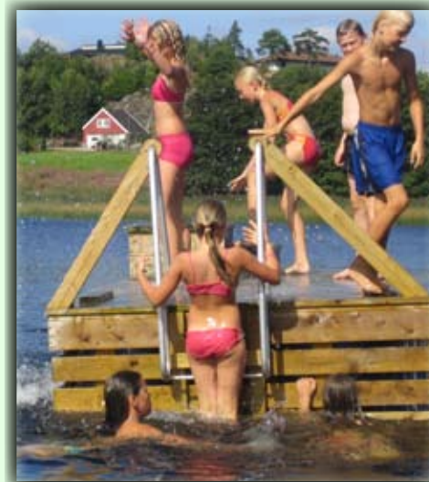
Om sommeren er det et yrende badeliv i Berse

Von Birkeland Zentrum geht man gegen die Schulen/Tveide. Bevor der lange Schulhügel biegt man rechts bei Rennehaven ab. Man muss diesem Weg ca. 150m folgen, dann rechts und an zwei Bauernhöfe vorbei.