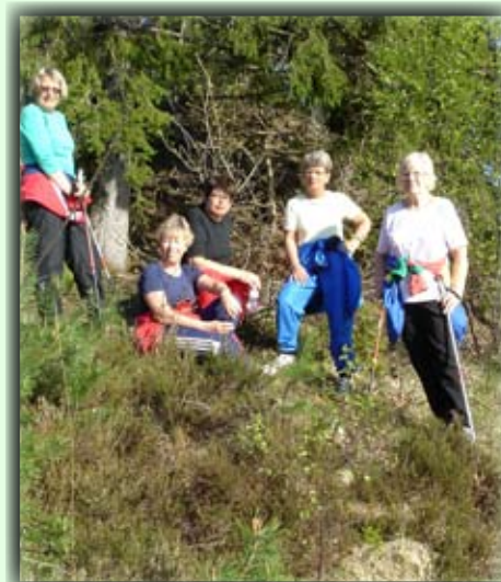
Damer på tur ved Røllend

Fra Birkeland sentrum går man veien mot skolene / Tveide. Før den lange skolebakken tar man opp Rennehaven til høyre. Følg denne veien ca. 150 m, ta ned til høyre og gå forbi to gårder.