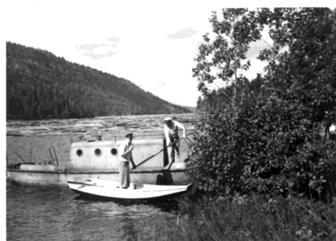
Her er en av Padda- båtene som tidligere gikk på Herefossfjorden