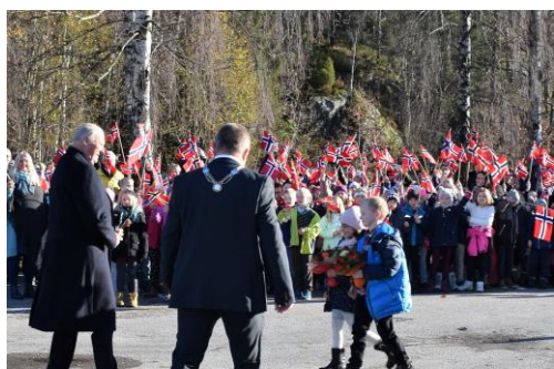
Kong Harald var rundt på flere steder i bygda som var blitt rammet av flommen. Han spiste lunch på kommunehuset der han bl.a ble møtt av flere hundre skolebarn!