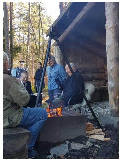
Kong Harald var på besøk i gapahuken på Elveplassen like etter den store flommen i 2017.