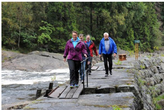
Fløtermuren like ovenfor Teinefossen ble besøkt av miljøvernminister Tine Sundtoft 24. august 2015 i forbindelse med åpning av ny elvesti.