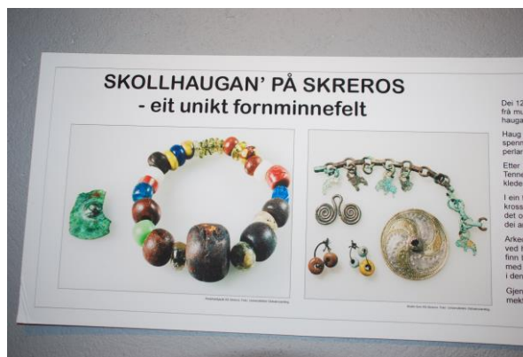
Disse smykkene ble funnet i gravene på Skrerros og ligger nå hos Oldsaksamlingen i Oslo.

Det er også funnet rester etter myrmutvinning ved Haukomvannet i Vegusdal. Like ved der stokkebåtene ble funnet. Myrmutvinning foregikk på 800-900 tallet til 1300-1400 tallet. En haug med slagg(avfall) er tydelig der i dag og bærer navnet Sinderhaugen.