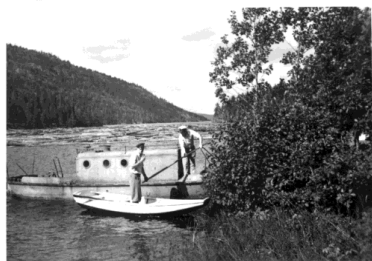
En av «Padda»-båtene som gikk på Herefossfjorden.