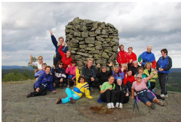
På Håstølknuten har det i mange år stått en stor varde. Denne falt dessverre sammen i 2018!

I tidligere tider ble det bygget varder på toppene flere steder i Birkenes. De ble bygget for å varsle folk innover landet om krig og ufred. De fleste ble bygget på 1000-1100 tallet, eksempelvis Håstølknuten og Haukomheia. Noen mindre varder ble også brukt som veivisere, f. eks på Breisåsnaben og på Tjomefjellet i Vegusdal. Noen varder ble bygget som retningsvisere, gjerne kalt gluggevarder. Det finnes en slik varde i Fidjemark. På Brøvardheia er det seks ganske like høye varder. Det er usikkert hva disse vardene betyr.