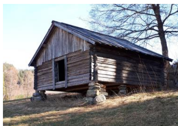
Løa «Levemåten» er blitt et kjennemerke for Herefoss.