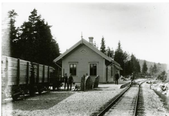
Tveide stasjon er nå kjøpt av LFB AS