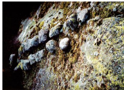
Likkvile i Vegusdal