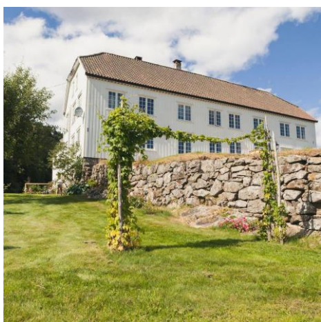
Flakk gård ligger ved Flaksvand/Tovdalselva