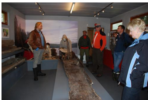
I magasinbygningen på museet ligger en av stokkebåtene utstilt. Bildet er tatt på en kulturminnedag i 2011.