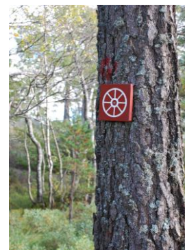
Den gamle Kongeveien, Futevegen og Kjørkevegen i Vegusdal er alle merket med slike skilt.