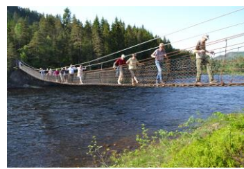
Slågedalsbrua før og etter restaurering. Brua har vært mye brukt etter restaureringen.