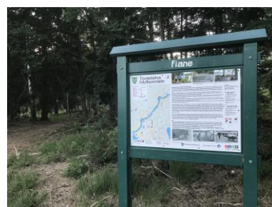
På Flane står det skilt som forteller om fløtingen i elva.

I Birkenes har vi i flere år satset på å synliggjøre ulike kulturminner i forbindelse med nye turstier og ikke minst gjennom den årlige kulturorienteringen. Kulturorienteringa startet opp i 1998 og er et samarbeid mellom orienteringsgruppa i Birkenes IL og kulturkontoret. 40 poster legges hvert år ut i Birkenesnaturen. De fleste postene legges til severdigheter eller kulturminner. Folk kjøper en konvolutt med kart og hefte med gode beskrivelser og bilder av de ulike kulturminnene. Også langs enkelte turstier er det satt opp informasjonstavler om kulturminner f.eks langs elva. På denne måten får folk god trim, de blir kjent i kommunen og de får kunnskap om lokal kulturarv/historie. Det er folkehelse i hvert et steg!