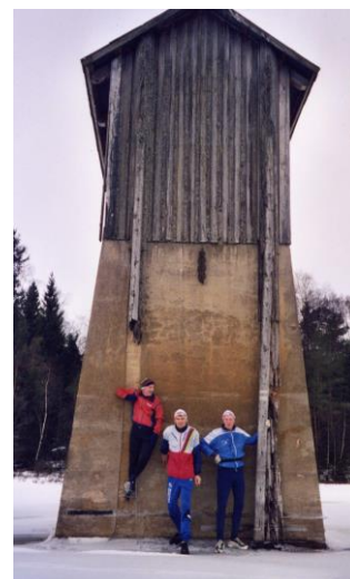
Bomhuset står den dag i dag ute i vannet på Flaksvann.