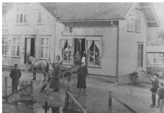
Til venstre sees kjerraten på Flaksvann. Til høyre ser man at det var et yrende liv utenfor butikken på Flaksvann som var bygdesentrum før Birkeland ble bygget opp.