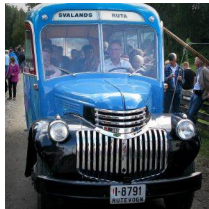
Svalandsruta fra 1946 er blitt restaurert av en god dugnadsgjeng.