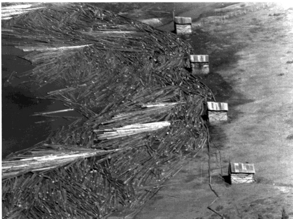
Det ble noen store mengder med tømmer i Flaksvann som ventet på å bli transportert videre. Her ser vi fire av de seks steinfylte bomhusene som holdt Fiansbommen på plass.

organiserte former, og særlig etter opprettelsen av fellesfløtingen i 1874 og fram til 1950-60-tallet førte dette til relativt store tilpasninger langs hele elveløpet gjennom fløtermurer. Stemmer ble bygd i de fleste sideelver, for eksempel Digeelva. Sidebekker har dannet grunnlag for flere sagbruk og bekkeverner. Rester av slike finnes mange steder. Det ble gitt kongelig løyve til å sette opp sag i Stovlandsbekken vest for Herefossfjorden i 1790, og det var bekkevern her fra 1661. På Heimdal var det kvernhus og sagbruk.