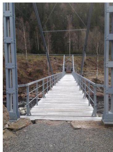
Slettane bru etter restaurering i 2013