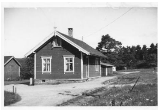
Birkeland stasjon eksisterer ikke lenger.

Det fantes opprinnelig to stasjoner, Flaksvand og Lillesand, stoppestedene Birkeland, Tveide og Storemyr, samt holdeplassene Eigeland, Stene og Møglestu. På Birkeland, hvor det opprinnelig ikke var planlagt noen tilknytning, la jernbanen grunnlaget for Birkeland som sentrum i Birkenes. Stasjonsbygningene var tegnet i sveitserstil. De var prefabrikkerte, sterke og holdbare av lafta, dobbeltplyde planker, men husa var dårlig isolerte. Etter hvert ble også Tveide og Birkeland kalt stasjon. Bolig for banevoktere ble etablert på Tveide og i Modalen.