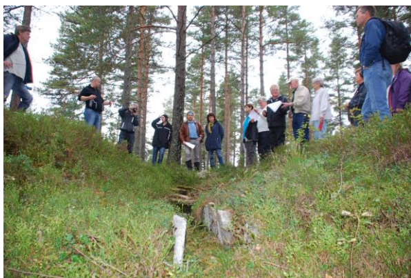
En av de utgravde gravene på Skrerros. Bildet er fra kulturminnedag i 2011.

Kanskje det mest interessante funnet i Birkenes er gravhaugene på Skrerros, som dateres til jernalderen. Her ligger det ti rundhauger og to langhauger. I en av haugene er det spor etter et synlig gravkammer. Flere gjenstander fra utgravninger i 1917 ligger nå hos riksantikvaren, bl.a. smykker og leirkrukker. Et større gravfelt fra samme periode finnes også ved Vassbotn ved Ogge.