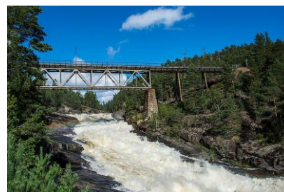
Jernbanebrua over Hanefossen er et mektig skue.

Mål: Vedlikeholde og utvikle noen av disse veiene og stiene slik at de er tilgjengelige til enhver tid for allmennheten. De stiene som ligger nær der folk bor, og som vil bli brukt, skal prioriteres.