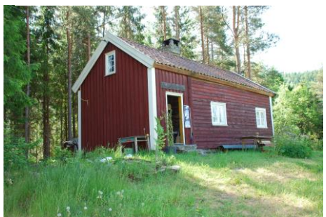
I dag står Øvrehus (Elvegaard) i Sløgedalen.

Ved Husehølen like nord for Birkenes kirke, langs den gamle postveien, lå det to husmannsplasser under gårdene på Østre Mollestad. Det var Øvrehus og Nedrehus. Begge plassene solgte kaffi og mat til kjerkefolk. Nedrehus ble revet midt på 1900-tallet, men Øvrehus eksisterer fortsatt. Offisielt het det Elvegaard, men det blei kalt for Huset. Det gamle Huset blei revet i år 2000 og gjenreist i Slogedalen i 2003.