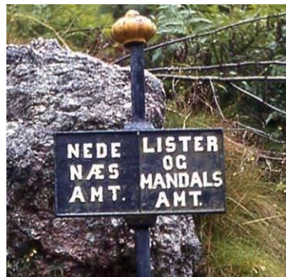
Dette skiltet står fortsatt ved Erkleiv.

Pikksteiner er det også synlige rester etter langs samme vei. Dette var ofte fruktbarhetssymboler og ble satt opp i