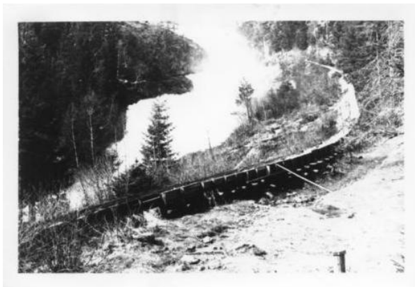
Sagbruket til venstre er Flaksvand dampsag og høvleri (1899-1910) og bildet til høyre er fra den gamle tømmerrenna i Flakkefossen.