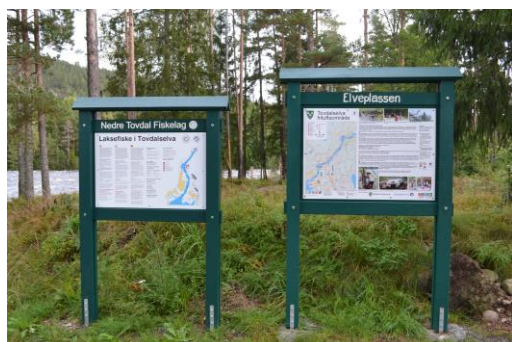
Fra Fiane og opp til Slettane bru er det skiltet og merket tursti. Det er også satt opp skilt med informasjon om ulike kulturminner.