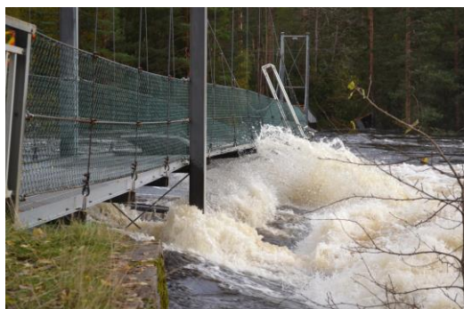
Flakkebrua holdt på å ryke under flommen i 2017

Enkelte kulturminner langs elva har blitt ødelagt eller fått skader som følge av flommer. Både bruer og tømmer skjermmer har blitt skadet.