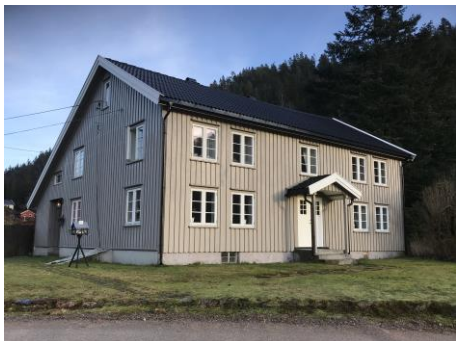
Rislå gård ligger idyllisk ved elva på Senumstad/Rislå.