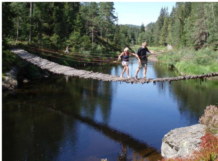
Brua ved Vrangefoss i Digeelva er blitt restaurert slik at den nå er gangbar.