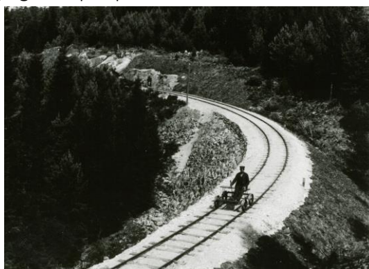
Den store muren

Lina er bygd opp av mange fine natursteinsmurer. Spesielt stor og fin er muren sør for Natveitåsen og likedan murer langs elva sør for Modalen. Flere av de fine stikkrennene fra jernbanen er godt bevarte.