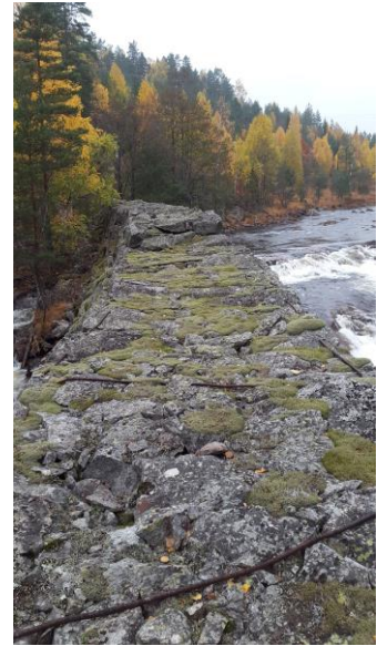
Skjerm ved Storfossen i Herefoss

Mål: Sørge for at flest mulig av fløterskjermene i Tovdalselva er intakte. Sørge for at noen av skjermene i sideelvene tas vare på.