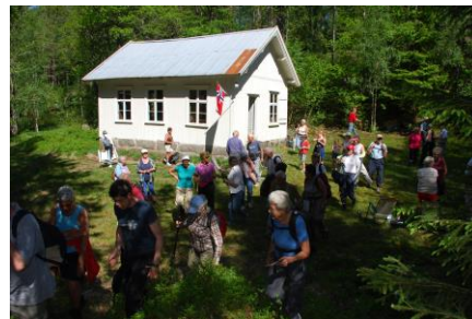
Bildet er fra en kulturorienteringsfrokost i 2009 ved det gamle skolehuset på Heimdal. Dette er meget godt bevart, både eksteriør- og interiørmessig.

Birkenes IL har også gjennom årenes løp gitt ut flere turkart som har en mengde kulturhistoriske opplysninger på baksiden; Birkeland 1997, Oggevatn 2007, Ogge 2014, Birkeland 2019. Opplevelseskart Øynaheia og Toplandsheia ble gitt ut av Friluftsrådet sør i 2006. Det finnes også et gammelt kart over Oggemarka fra 1957 som ble laget av NSB i samarbeid med Donn og IK Start.