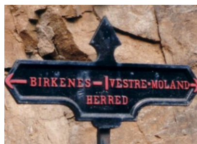
Skiltet sto tidligere på grensa mellom Birkenes og Lillesand langs Fv 402 ved Modalen.