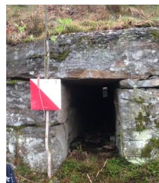
Denne stikkrenna ligger ca 200 m før Tveide.