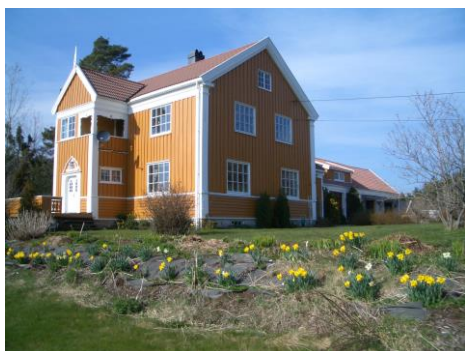
Villaen slik den ser ut i dag. Huset ble flyttet fra Oslo og gjenreist nær Teinefossen i 1915.

Foruten sagbruka som er omtalt andre steder, var det flere bygninger langs elva. Teinefosshuset sto på oversiden av den nåværende Mosfjellveien like ved Teinefossen.