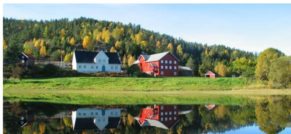
Nes gård ved Herefossfjorden

SEFRAK-registeret viser mange bevarte bygninger eldre enn 100 år spredt langs hele vassdraget. Et av de eldste er Nes gård på Herefoss som ligger idyllisk til ved fjorden. Den var tidligere sorenskriver-gård. Hovedbygningen på Nes ble bygget i 1763-1764, og eksteriøret er nesten uforandret i dag. Gården er i privat eie.