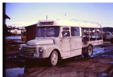
Den gamle melkeruta som gikk mellom Lillesand, Birkeland og Herefoss.