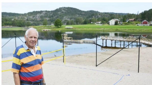
I 2019 ble det etablert sandvolleyballbane og laget ny sandstrand med brygge i Kirkekilen på Herefoss i regi av Velforeningen «Herefoss utvikling»

Mål: Holde vedlike etablerte tiltak og utvikle nye