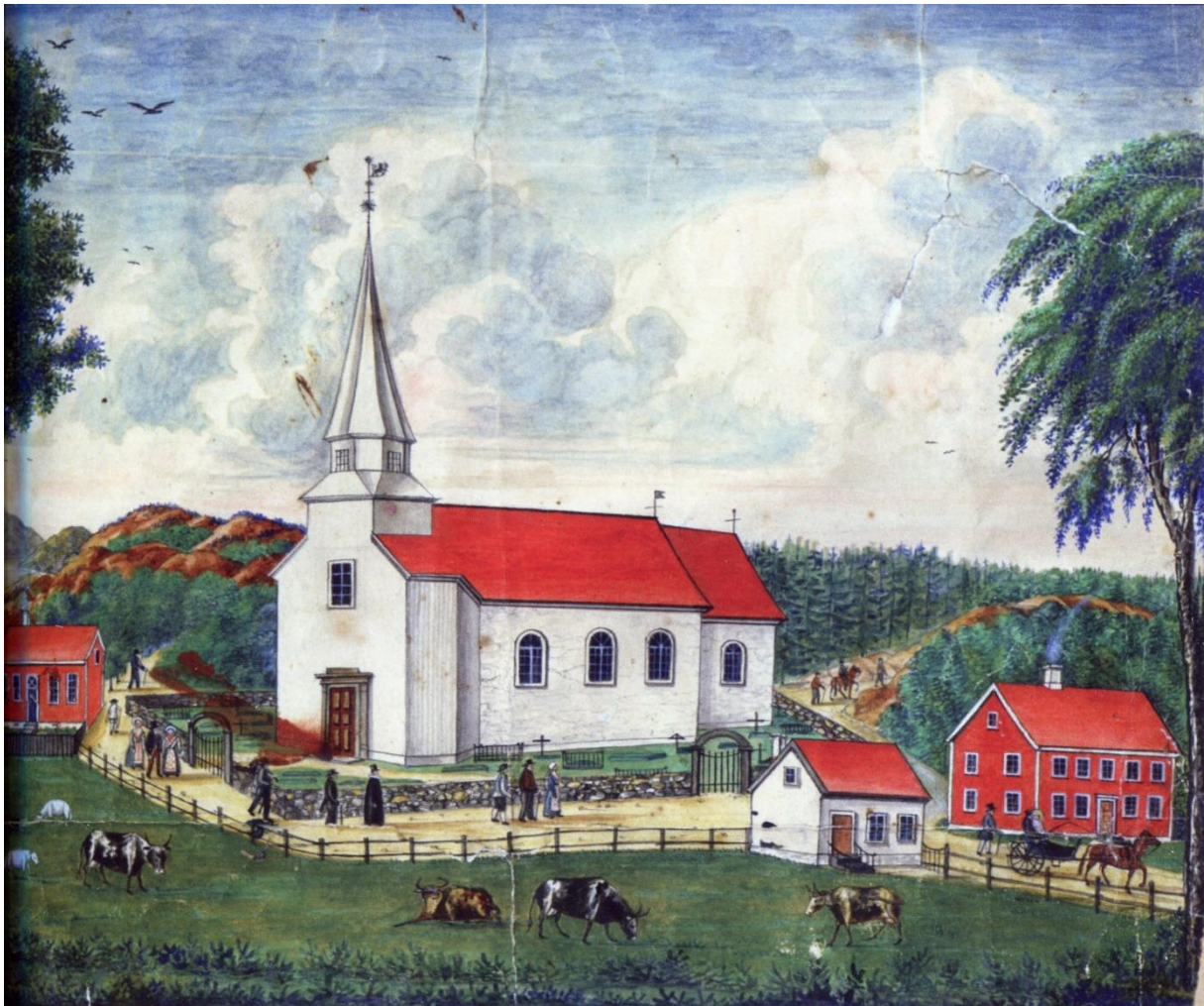
Den gamle middelalderkirka i Birkenes