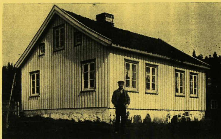
Havane på Birkeland