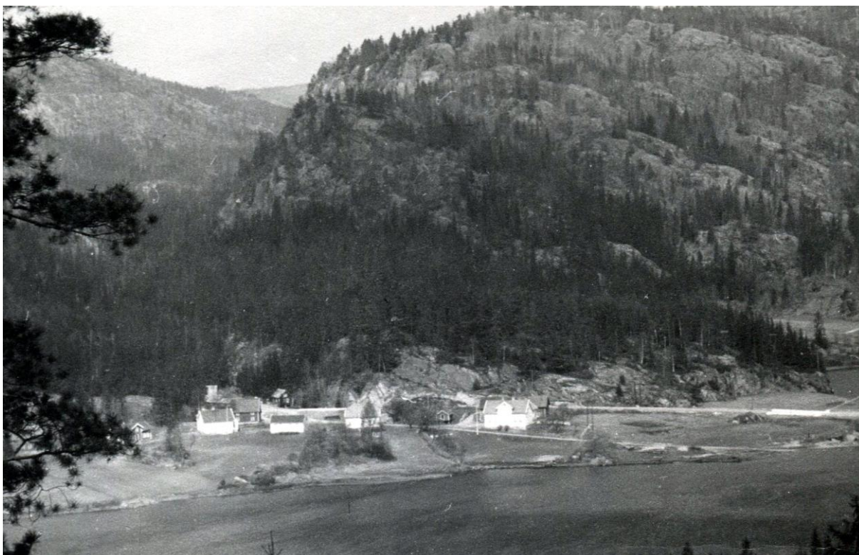
Senumstad. Dinas heim til høyre