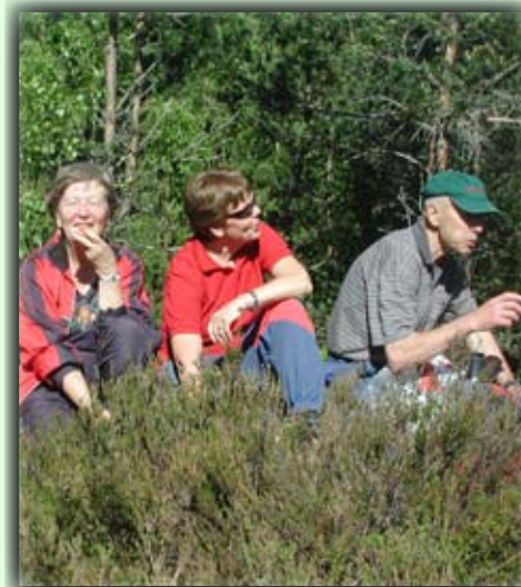
Matpauser er viktig når man er på tur!

Das Pfad geht südlich von Fluss Haugevann, kreuzt den Fluss und geht weiter hinauf. Die ersten Kilometer gehen hinauf, aber das meiste von der Wanderung ist einfach in idyllischen Umgebungen. Anfangspunkt: Von Birkeland Zentrum muss man Nordåsveien durch das Baugelände bis man einen Parkplatz und Informationsschild an Nr. 52.