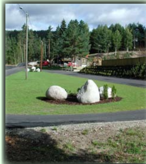
Skiskytterstadion i Birkenesparken ble åpnet til sommer -NM i ruller ski 2006