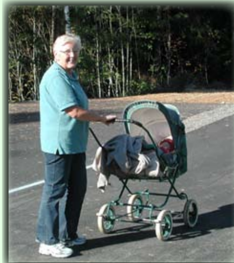
Den nye asfalterte turstien passer godt for turer med barnevogn

Anfangspunkt: Das Sportgebiet liegt links 300m nördlich von Birkeland Zentrum.