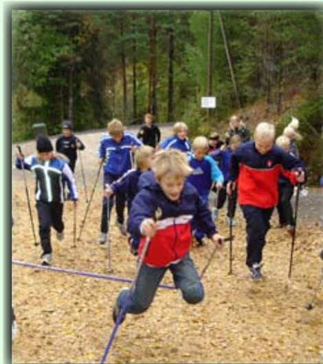
Full fres i lysløypa!

Birkenesparken ligger like ved riksveien, ca 300 m nord for sentrum.