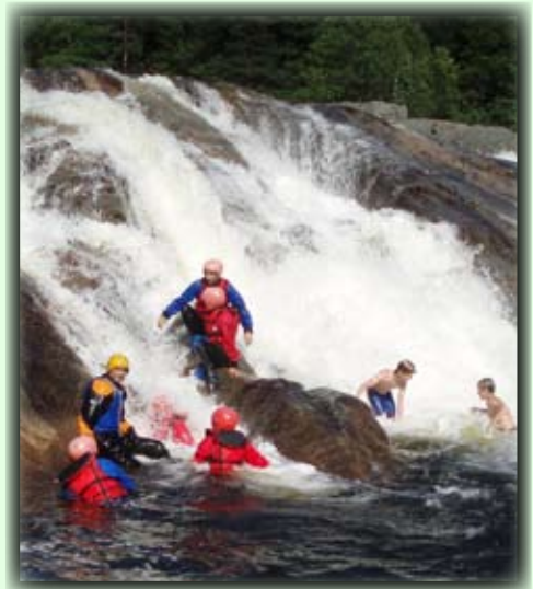
Teinefossen er en spennende badeplass spesielt for ungdommen