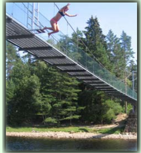
Å hoppe fra Flakkebrua er det mange barn og unge som gjør på sommeren

Fiske- og badeplasser: Det er flere fine fiske- og badeplasser langs elva.