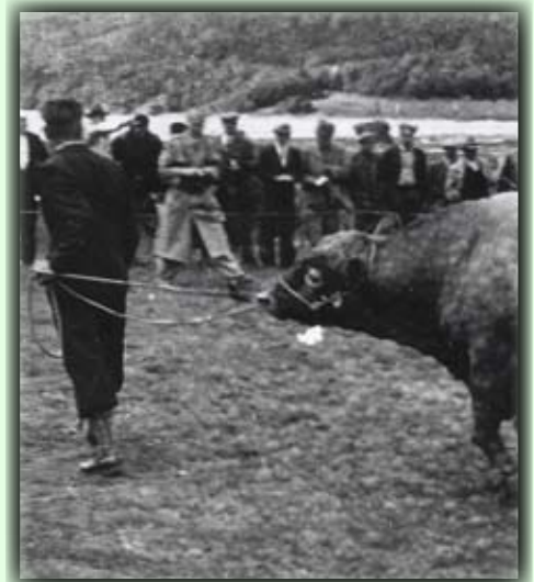
Før i tida var Fiane en populær samlingsplass. Bildet er fra et dyrsku på 50-tallet

Der Pfad geht dann durch wunderschöne Flussufer Umgebungen unten nach See Flakksvann. Zurück geht man zum Sportsplatz. Man kann auch zwischen den Brücken den östlichen Flussufer entlangwandern.