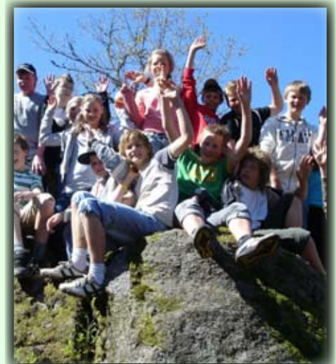
Skoleklasser er ofte på toppen og skriver seg inn i boka og nyter utsikten over hjembygda

Morhommer ist eine kleine Spitze/Aussichtspunkt über Birkeland Zentrum. Der Pfad fängt an Birkeland Schule an, geht um das südliche Ende der See Valtjønn und passiert durch Tøane Baugelände bis zur Spitze. Bis zum zweiten Weltkrieg fungierte Morhommer als eine Stelle, wo man verschiedene Ereignisse feierte, zum Beispiel unseren Nationaltag, Der Silvesterabend im 2000 wurde auch hier gefeiert und mehr als 500 Leute nahmen daran teil. Anfangspunkt: Tøane Eigentum ist südlich von Birkeland gegen Tveide zu finden. Parken wird empfohlen am Sportzentrum an den Schulen.