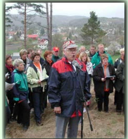
Syng våren inn på Morhommer!