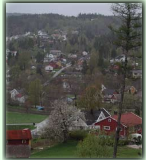
Utsikt fra Morhommer:

Tøane byggefelt ligger sør for Birkeland sentrum mot Tveide. Hvis man har bil anbefales det å parkere ved Birkeneshallen og følge stien sør for Valtjønn mot Tøane.