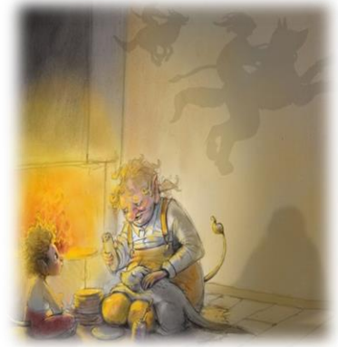
Illustratør: Lisa Aisato

Leken for barn, er lyst betont, den er indre motivert og den er på liksom, men allikevel så på alvor. Når barn leker, bearbeider de inntrykk og erfaringene de gjør seg. De leker her og nå, og har en egenskap til å være tilstede i leken og i situasjoner, som vi voksne bare kan drømme om å oppnå selv. Lekens egenverdi har ikke bare betydning for her og nå situasjonen, men den har et livslang forløp videre inn voksen livet. I leken kan barnet lære å ta hensyn, vente på tur, gjøre seg språklige erobringer og danne vennskap som kan vare livet ut. Dette er bare noen få av de mange, positive erobringer som barnet gjør seg i lekens samspill.