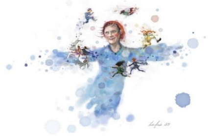
Illustratør: Lisa Aisato