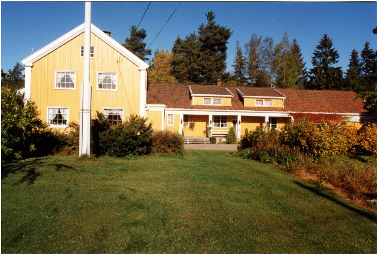
Bondegaarden. Bildet er tatt høsten 1993.