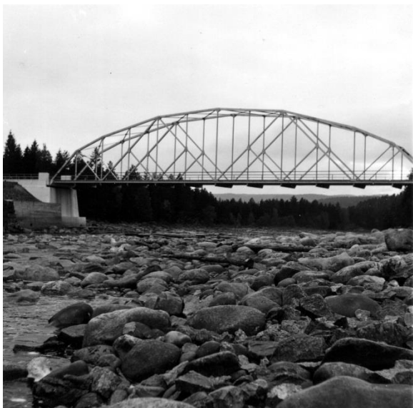
Nedenfor Teinefoss i juli 1959

Teinefossen skifter derfor fort utseende etter årstidene og været. Som døme på det kan nevnes året 1959. Da var fossen nesten tørrlagt i juli og august, men breddfull under storflommen 16. november samme år.