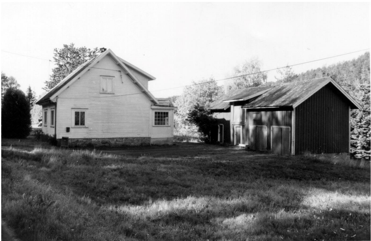
Halvorshus, Ydrehus, Birkelandsmoen