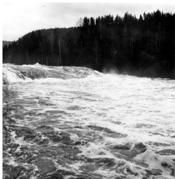
Teinefoss 16. november 1959