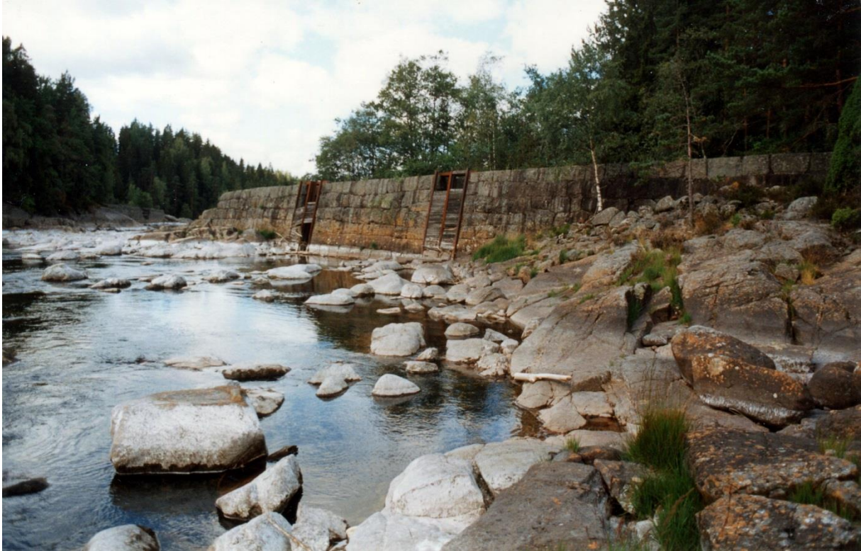
Vestre skjerm med åpninger for vann og tømmer