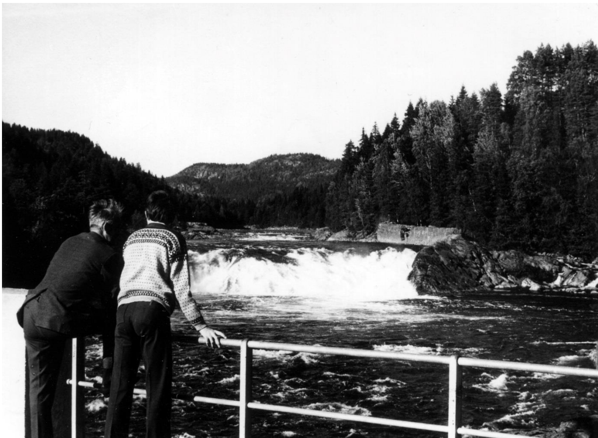
Teinefoss sett fra brua. Skjermen over østre løp til høyre.

Han besøkte Statsarkivet og fant skjøta, tinglyst 3. juni 1801, på den gården som ble delt i 1841. Der sto at eieren av gården eide 1/8 rettighet i laksefisket. De ville si at de to nye eierne fikk hver sin halvdel av 1/8, eller 1/16 rettighet hver. Han ba likevel om å få prøvd saka i Birkenes Forliksråd. Men der kunne de bare ta til etterretning det som sto i de tinglyste dokumentene, og saka ble henlagt.