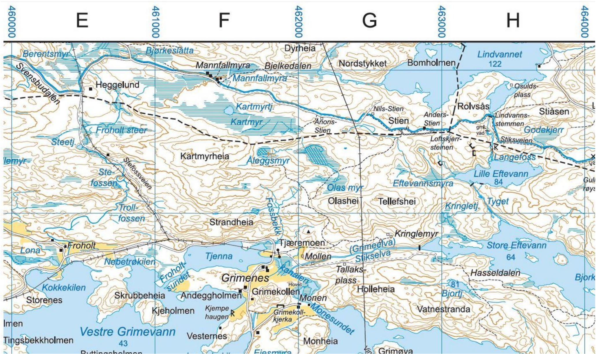
Barnevandrerstien gjennom Birkenes kommune —